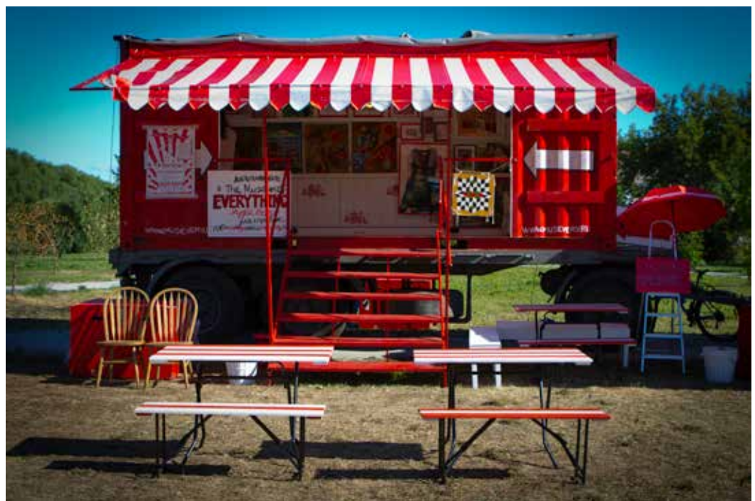
Writer: Chonnikam C., Suriya G.

เมื่อเดือนธันวาคมที่ผ่านมา เราย่านเสนอเรื่องราวการเดินทางทั่วรัสเซียของ Museum of Everything พิพิธภัณฑ์เคลื่อนที่จากเกาะอังกฤษที่มุ่งมันค้นหางานศิลปะและศิลปินที่ซ่อนเร้นอยู่ในหุบเขาเนินดินธรรมดาไปแล้ว หลังจากการเดินทางสุดมหากาพย์ที่ไปทั่วมอสโก เซนต์ปีเตอส์เบิร์ก และเมืองอย่าง Yekaterinburg, Kazan และ Nizhny ครั้นนั้นพวกเขาจะกลับไปรัสเซียอีกครั้งในเดือนเมษายนเพื่อจัดนิทรรศการแสดงผลงานที่พวกเขาค้นพบระหว่างการเดินทาง Exhibition #5 ครั้งนี้จะมีศิลปินผู้ถูกค้นพบมากกว่า 50 คน และพวกเขากำหนดศิลปะของงานนี้จะเป็นการเย็บการออกแบบงานศิลปะของรัสเซีย ถ้าคุณรักงานศิลปะที่ทางพิพิธภัณฑ์นี้เรียกว่า low art นี้คงจะเป็นอีกงานที่คุณไม่ควรพลาด Museum of Everything สัญญาว่าถ้าคุณขึ้นเครื่องมาเขาจะเสิร์ฟ horseradish vodka แน่นอน • จัดแสดงที่ The Garage Centre for Contemporary Art ใน Gorky Park กรุงมอสโก ตั้งแต่ 25 เมษายน - 2 มิถุนายน www.musevery.ru