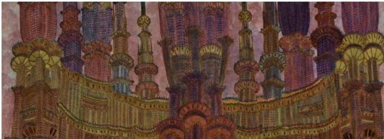
Los cuadros intrincados de Marcel Storr imaginan la arquitectura de París tras una hecatombe atómica